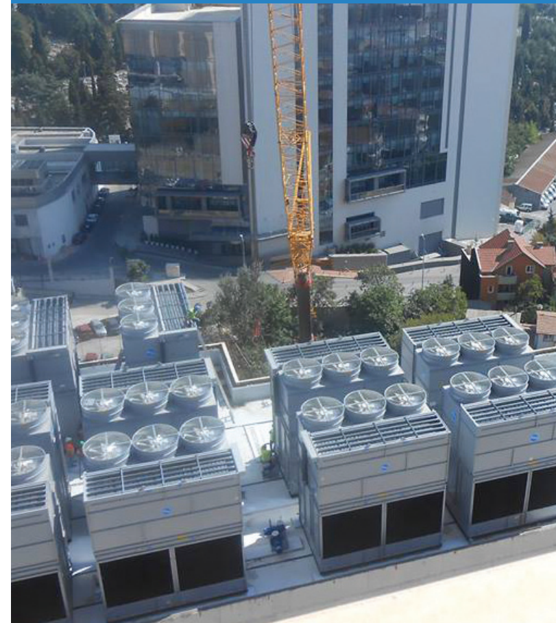
Titelbild: ©Baltimore Aircoil International nv

Lehren aus Warstein und Ulm aus technischer Sicht